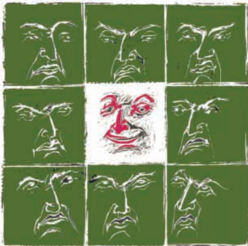
Ilustraciones: LETRAS LIBRES / Fabrizio Vanden Broeck

ción y la práctica de la democracia. La cultura de la participación puede ser una virtud cívica toral, como lo expuso ampliamente Condorcet, entre otros pensadores sobresalientes de la Ilustración europea.